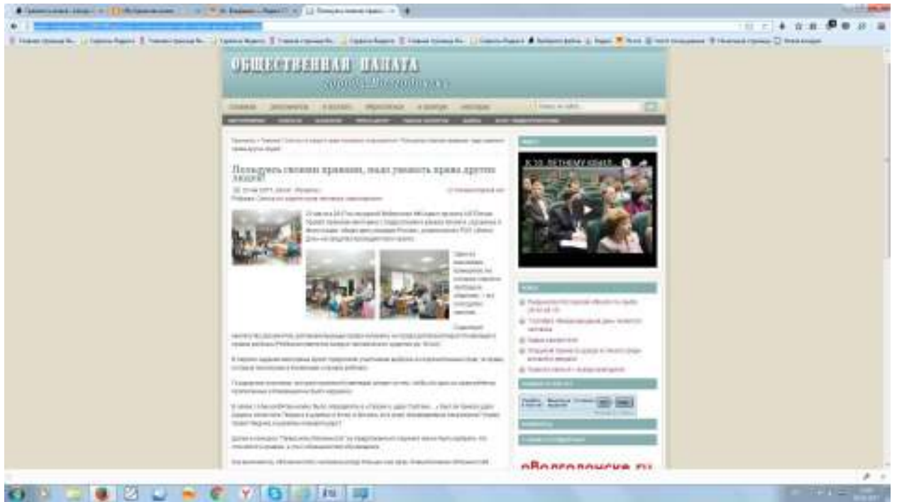
Кадры решают все!